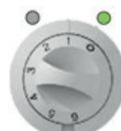
Gerät ist „AN“ aber kein Heizbetrieb