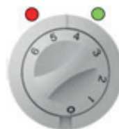
Gerät ist „AN“ und im Heizbetrieb