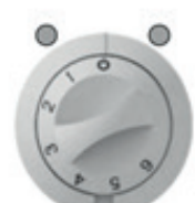
Gerät ist „AUS“